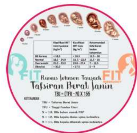
Gambar Lapis Bagian Belakang Maternal Cycle Simulation

Adapun tahapan dalam penelitian ini, yaitu: 1) Pretest dan penjelasan kepada responden tentang media Maternal Cycle