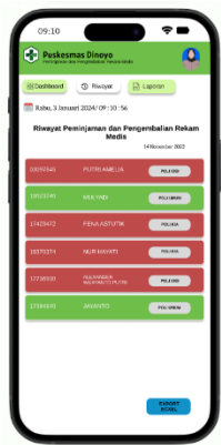
Gambar 4. Tampilan Fitur Riwayat

Terdapat perbedaan warna yang digunakan. Warna hijau menandakan bahwa dokumen telah kembali dan