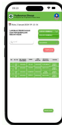
Gambar 5. Tampilan Fitur Laporan

Petugas dapat melakukan pencarian dengan menggunakan nomor rekam medis untuk mencari 1 (satu) dokumen atau dengan memilih pada button di sebelah kanan dengan memilih laporan dokumen sudah kembali atau dokumen belum kembali. Kemudian petugas memilih tanggal awal dan tanggal akhir untuk melakukan filter laporan. Setelah melengkapi data kemudian klik button “Tampilkan”.