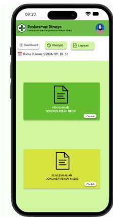
Gambar 3. Desain Fitur Dashboard

Pada desain Interface tampilan dashboard menu petugas akan diberikan pilihan menu yaitu menu peminjaman dokumen rekam medis dan menu pengembalian dokumen rekam medis.