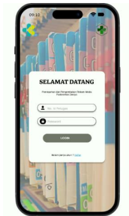
Gambar 1. Desain Tampilan Login

Desain Interface tampilan login peminjaman dan pengembalian rekam medis pasien berbasis android.