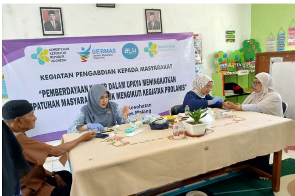
Gambar 3. Pengukuran Gula Darah dan Tekanan Darah pada Peserta Prolanis

Setelah dilakukan pengukuran kadar gula darah, ditemukan fakta banyak warga yang menderita penyakit DM, namun sebagian besar tidak menyadari hal tersebut hanya mengeluhkan gejala lemas, mudah lelah dan menurunnya berat badan. Oleh karena itu pada pengabdian masyarakat ini dijelaskan terkait penatalaksanaan penyakit Diabetes Militus. Penatalaksanaan DM dan HT meliputi nonfarmakologi atau perubahan gaya hidup, yaitu penurunan berat badan, penurunan asupan garam, serta menghindari faktor resiko seperti merokok, minum alkohol, hiperlipidemia dan stress (Helmi & Veri, 2024). Sedangkan penatalaksanaan secara farmakologis atau dengan obat dilakukan dibawah pengawasan dokter (Putri et al., 2024).