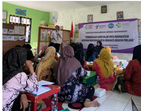
Gambar 1. Peserta Diberikan Edukasi Terkait Prolanis

melakukan edukasi kepada Kader kesehatan terkait pentingnya Prolanis dan pelatihan kepada kader agar dapat melakukan screening Diabetes Melitus dan Hipertensi. Kegiatan Pengabdian Kepada Masyarakat dilaksanakan sebanyak dua kali yaitu pada tanggal 20 Juni 2024 dan tanggal 10 Agustus 2024. Kegiatan pertama berupa edukasi terkait Prolanis dan pengelolaan penyakit DM dan HT yang ditujukan kepada Kader Kesehatan dan Pengurus PKK Kelurahan Ketawanggede.