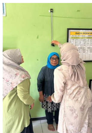
Gambar 2. Peserta Diberikan Pelatihan Mengukur IMT

Kader Kesehatan dan Masyarakat di Kelurahan Ketawanggede sebagai Probandus. Rangkaian kegiatan pengabdian kepada masyarakat dilanjutkan dengan memberikan pelatihan kepada Kader kesehatan untuk dapat melakukan screening DM dan HT. Adapun pelatihan yang diberikan meliputi pengukuran tinggi badan, berat badan, pengukuran Indeks Massa Tubuh (IMT), mengukur gula darah dan tekanan darah.